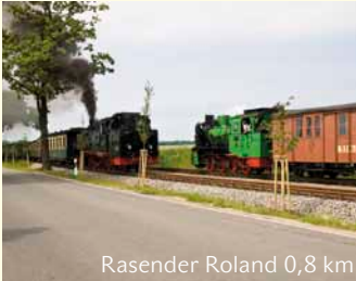
Rasender Roland 0,8 km