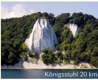
Königsstuhl 20 km