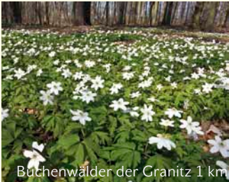
Büchenwälder der Granitz 1 km