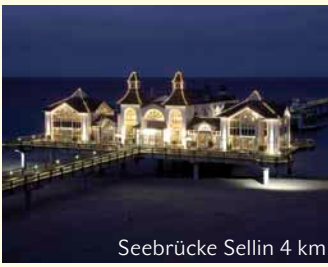
Seebrücke Sellin 4 km