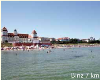
Binz 7 km