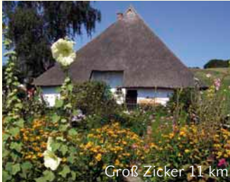
Groß Zicker 11 km