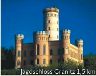
Jagdschloss Granitz 1,5 km