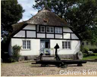
Göhren 8 km